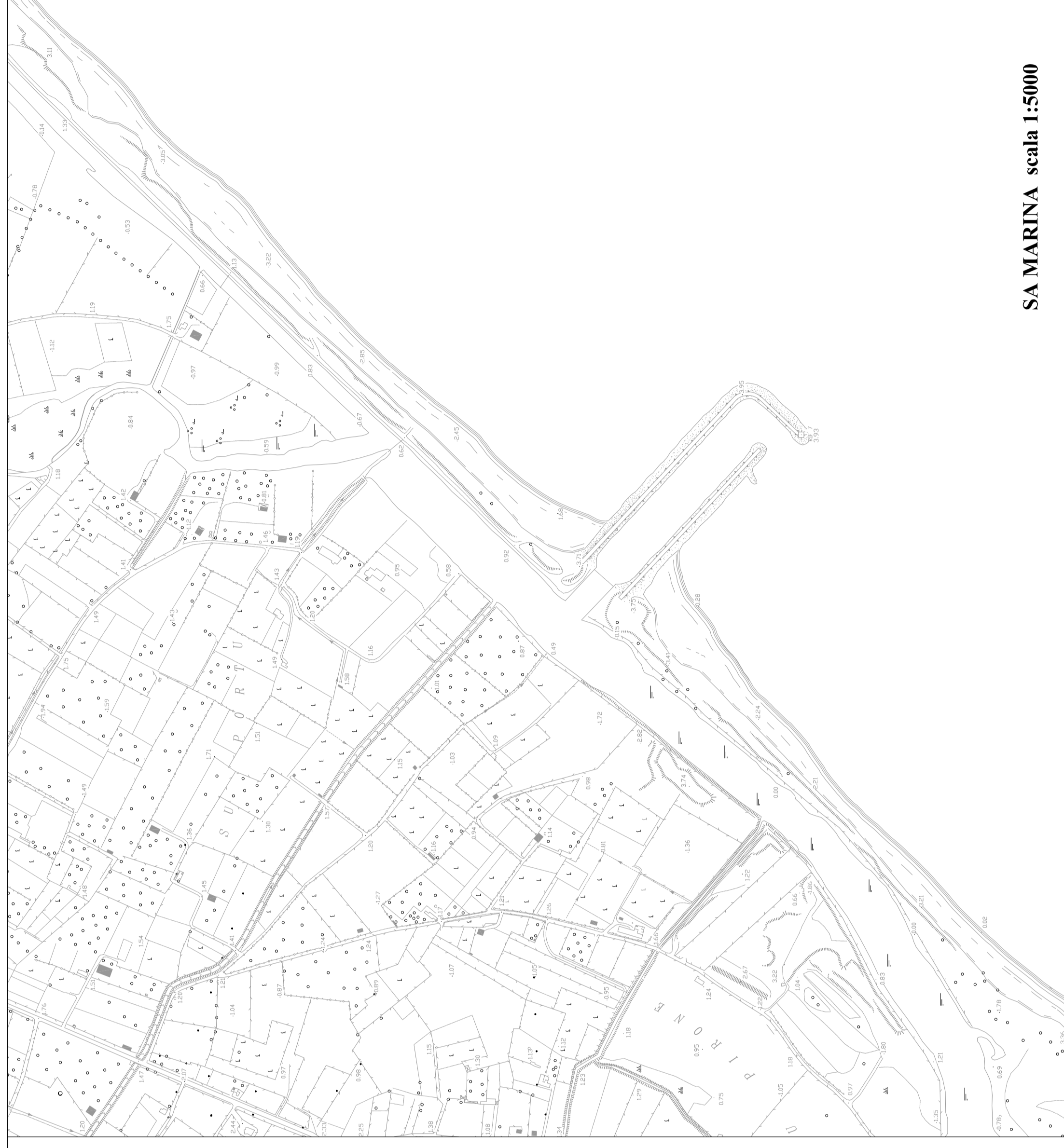
SA MARINA scala 1:5000